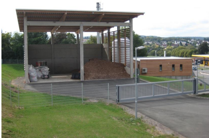
Offene Halle am Heizwerk Wetter für die Beschickung des Biomasseheizwerks mit Holzhackschnitzeln.

Die vergangene Heizperiode konnte ohne technische Probleme abgeschlossen werden. Nach Abschluss aller Wartungsarbeiten ist der Eigenbetrieb gerüstet für die anstehende kommende Heizperiode 2019/2020.