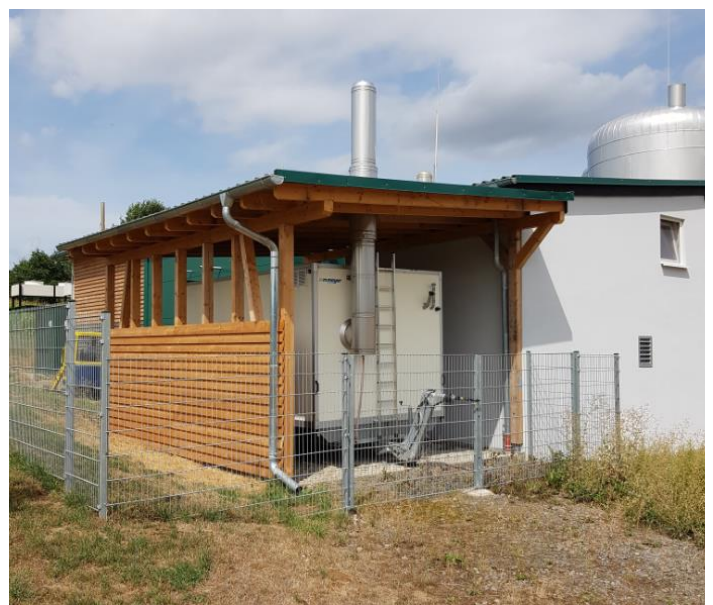
Überdachung des Stellplatzes für den mobilen Heizölkessel