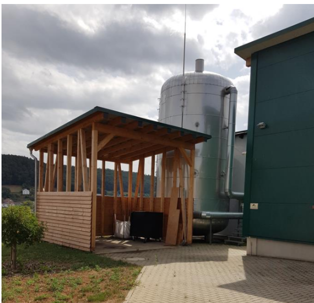
Überdachung des Aschelagerplatzes am Heizwerk Unterrosophe

Die fertige Nutzwärme wurde seitens der Stadtwerke Wetter (Hessen) bisher zu einem Preis von 39,00 € pro MWh an die Energiegemeinschaft verkauft. Ab dem Wirtschaftsjahr 2020 wird der Verkaufspreis auf 45,00 € pro MWh erhöht. Ab dem Wirtschaftsjahr 2021 ist eine nochmalige Erhöhung des Verkaufspreises auf 55,00 € pro MWh vorgesehen.